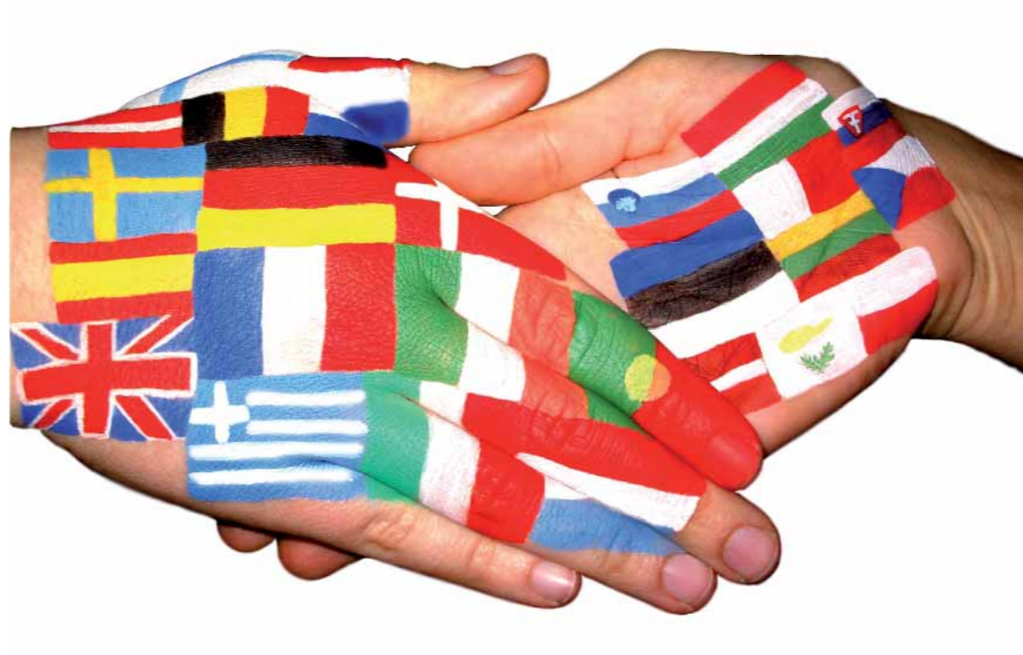
Plakat "Europatag 2004" (Ausschnitt) Hellweg Berufskolleg Unna