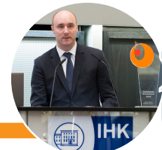
Diagramm Halbach GmbH & Co. KG (Schwerte) www.halbach.com

Für unser Unternehmen ist Vielfalt eine lebendige Auseinandersetzung und ein Gewinn an Möglichkeiten.