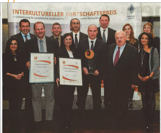
Der interkulturelle Wirtschaftspreis wurde in den Räumen der IHK Dortmund übergeben.